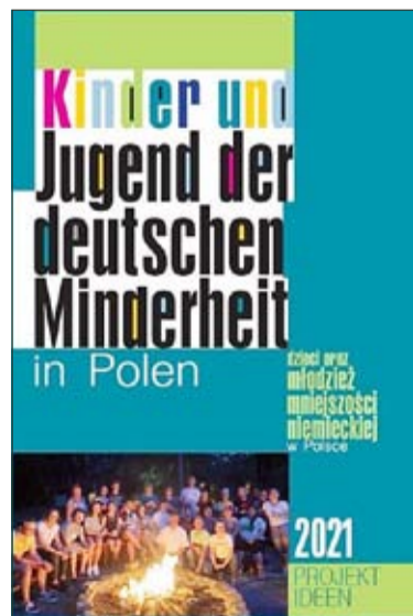
Die neue Broschüre des VdG richtet sich an die junge Generation.

Vor Kurzem hat der Verband der deutschen Gesellschaften in Polen eine Broschüre für die junge Generation herausgegeben. Der Titel „Kinder und Jugend der deutschen Minderheit in Polen. Projektideen 2021“. Die Broschüre richtet sich, wie der Titel schon andeutet, an Kinder, Jugendliche, Lehrer und Betreuer. Das Infoblatt wurde mit dem Ziel erstellt, jungen Angehörigen der deutschen Minderheit in Polen die Tätigkeit der DMI-Organisationen im Bereich Kinder- und Jugendarbeit näher zu bringen. In der Broschüre findet man mehrere Projektvorschläge, Aktivitä-