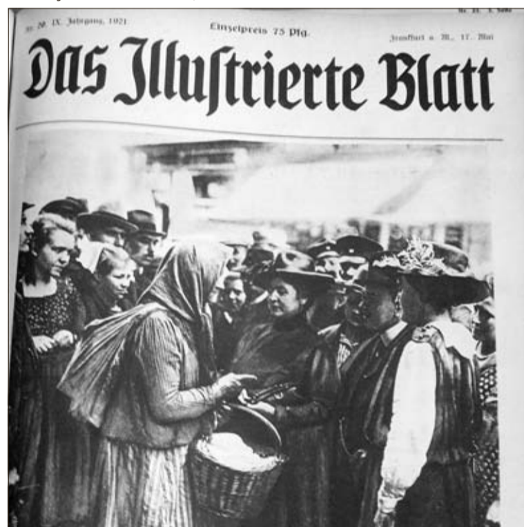
Die Titelseite: „Das Illustrierte Blatt“ aus Berlin, das eine Dorfbewohnerin zeigt, die auf dem Oppelner Marktplatz von dem polnischen Überfall erzählt.