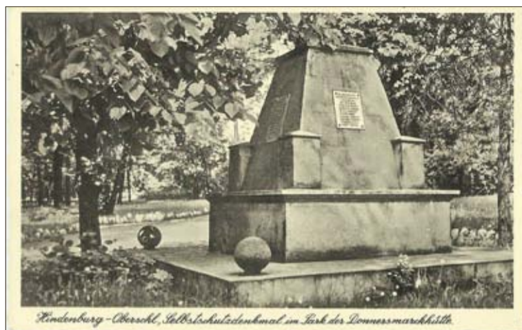
Hindenburg: Denkmal des Selbstschutzes, das nach dem Jahr 1945 zerstört wurde.