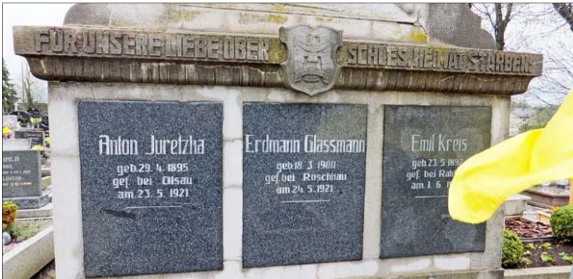
Das Denkmal der drei gefallenen Verteidiger Oberschlesiens in Kranowitz.