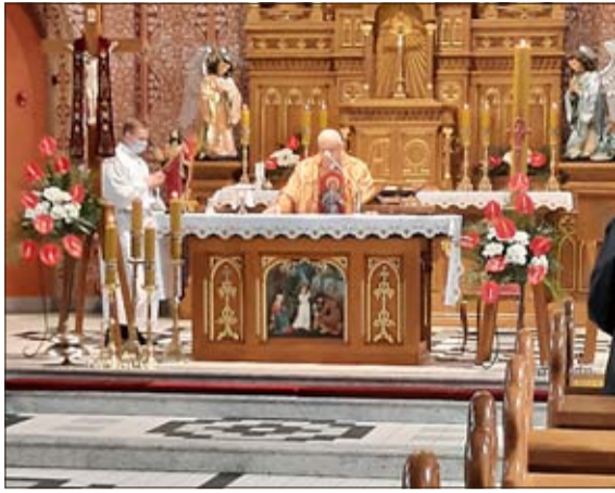
Die deutsche Jubiläumsmesse in Rydultau.