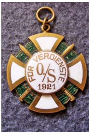
Oberschlesisches Verdienstkreuz Selbstschutz-Bataillon

Bis heute fehlt im öffentlichen Raum und in den Geschichtsbüchern eine objektive Beschreibung oder Darstellung dieser Ereignisse.