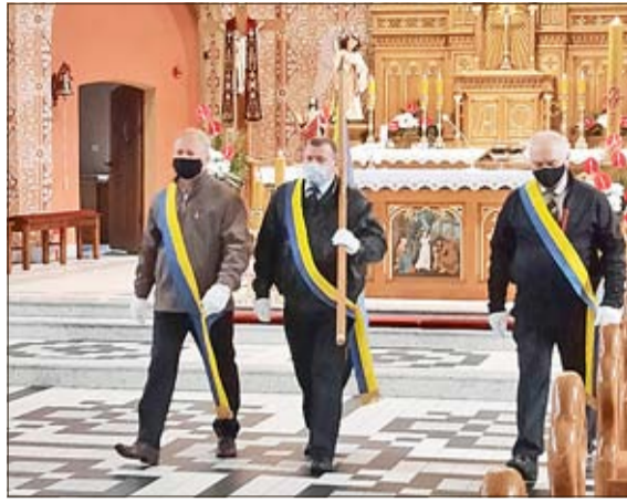
Die Fahnenträger gaben der Messe einen feierlichen Charakter.