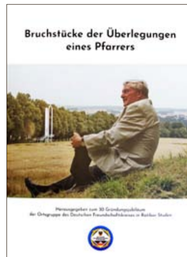
Das Buch über den Seelsorger von Ratibor-Studen.