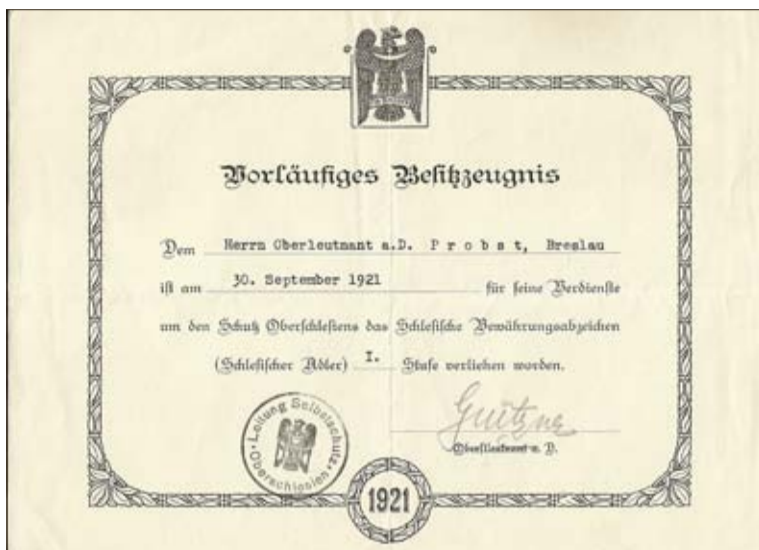
Verleihung des „Schlesischen Adlers“

Am 3. Mai um 11 Uhr trafen sich die Ratsmitglieder der Stadt, um die Situ-